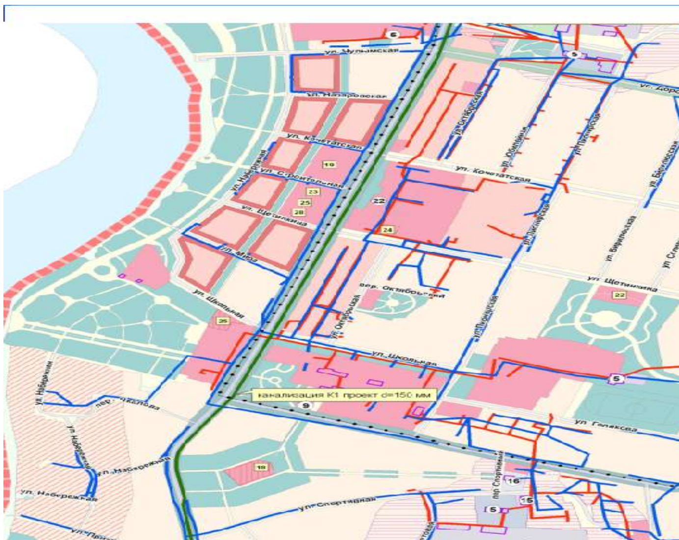
Рис. 1 Котельные с. Новобирилюссы